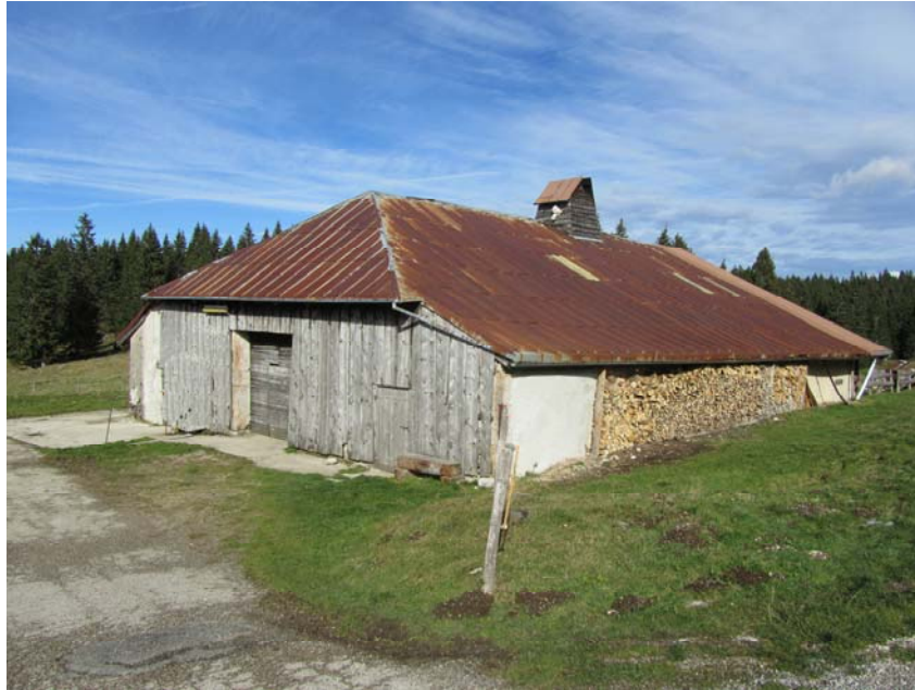
La Vielle Landoz, pignon à vent et façade orientale, si typique avec son vieux toit rouillé et sa belle grande cheminée.