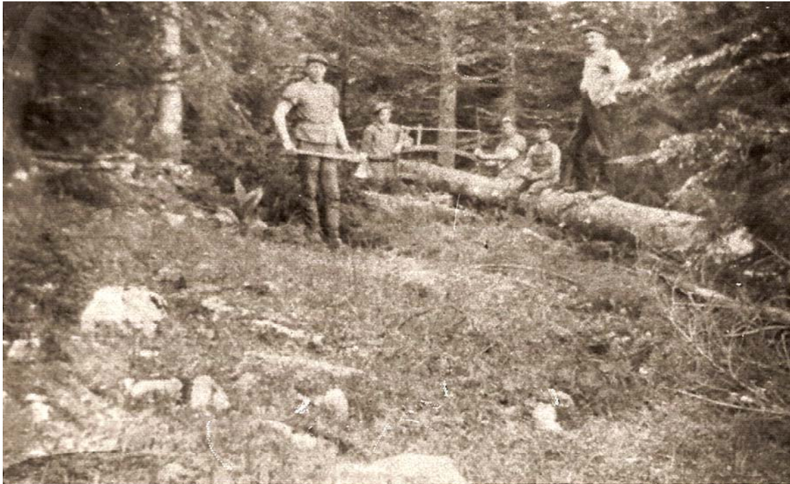
L'équipe au façonnage du bois de feu dans les environs du chalet.

grande scie à cadre, un engin des temps passés que l'on va abandonner bientôt au profit de la louve plus efficace, grande lame avec une poignée à chaque bout et que l'on tire alternativement à deux. Mais l'un dans l'autre, à cause du diamètre des troncs, on passe ses après-midi à scier, à monter les plots au chalet avec le tombereau, puis à refendre et à entêcher le bois, d'habitude sous l'avant-toit au couchant.