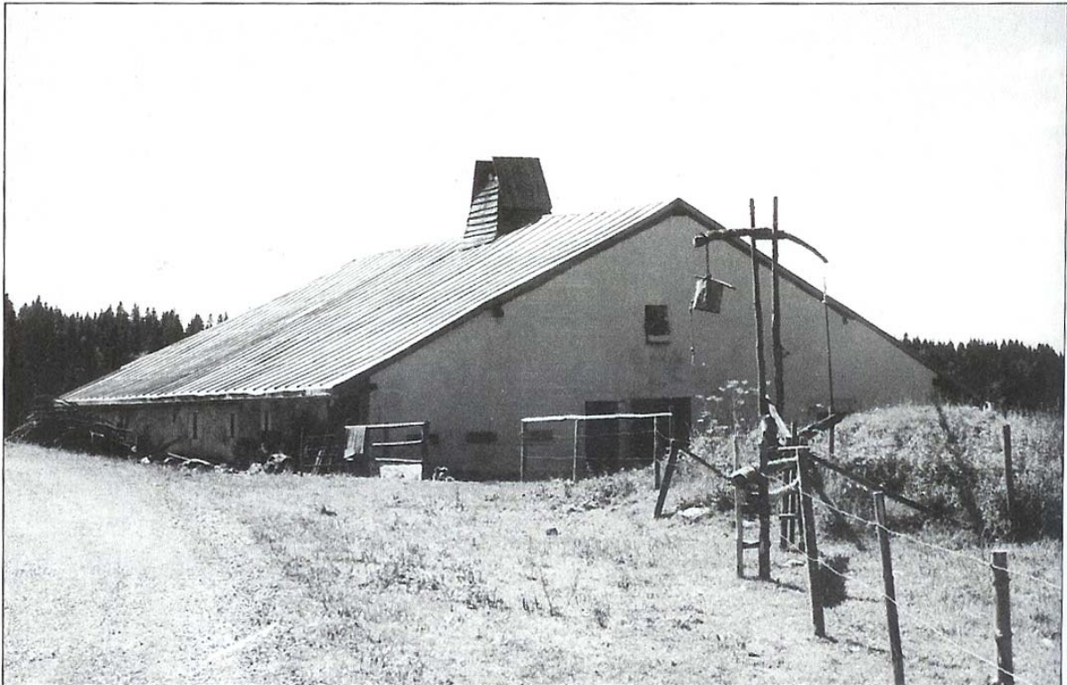
La Vieille Landoz est un exemple des typiques chalets d'alpage du Risoux. Les volets ou vantaux de la cheminée s'ouvrent ou se ferment de l'intérieur. Au premier plan, on remarque le balancier qui sert à puiser l'eau dans la citerne.

Mais auparavant il a pris de l'eau avec une louche dans un bidon qu'il a bu avidement, et même qu'elle vient de la citerne où se serait possible qu'il y ait une souris crevée dans l'eau, elle a un sacré bon goût ! Et puis il s'est assis derrière la vieille table pleine de marques de couteau de la cuisine, et c'est là, dans un bol rouge avec des pois blancs, à l'aide d'une grosse cuillère de bois, une véritable antiquité, qu'il a mangé sa crème. On avait pris celle-ci dans un