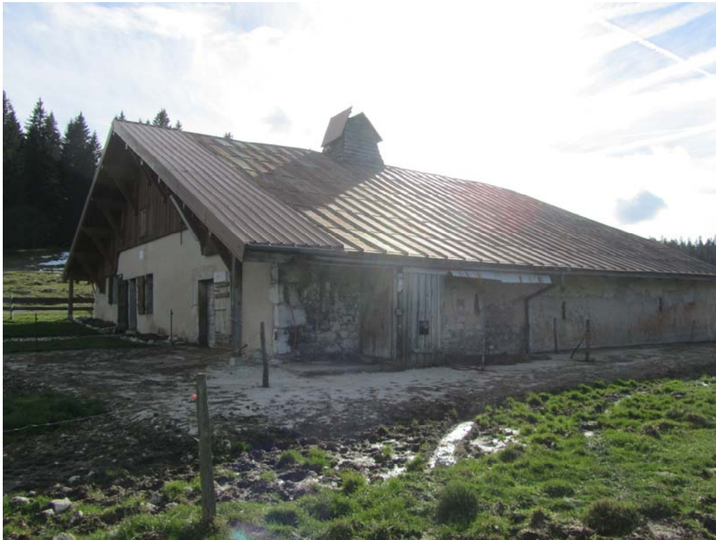
Pignon à bise et façade arrière qui ne paie pas trop de mine, ainsi qu'il arrive presque toujours aux chalets, là où le bétail patauge dans des abords trop terreux.