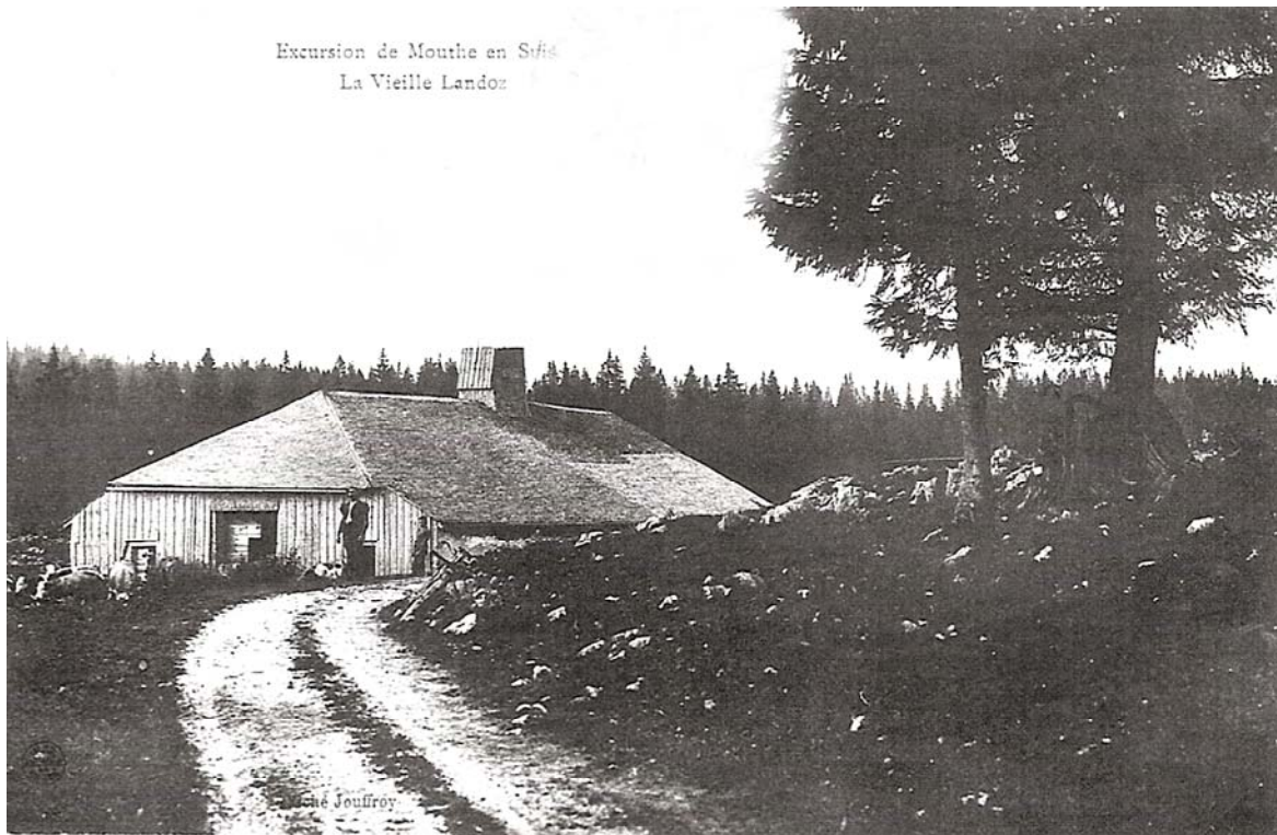
Carte postale de la vieille Landoz, façade à vent. On admirera le toit qui reste encore tout en tavillons.