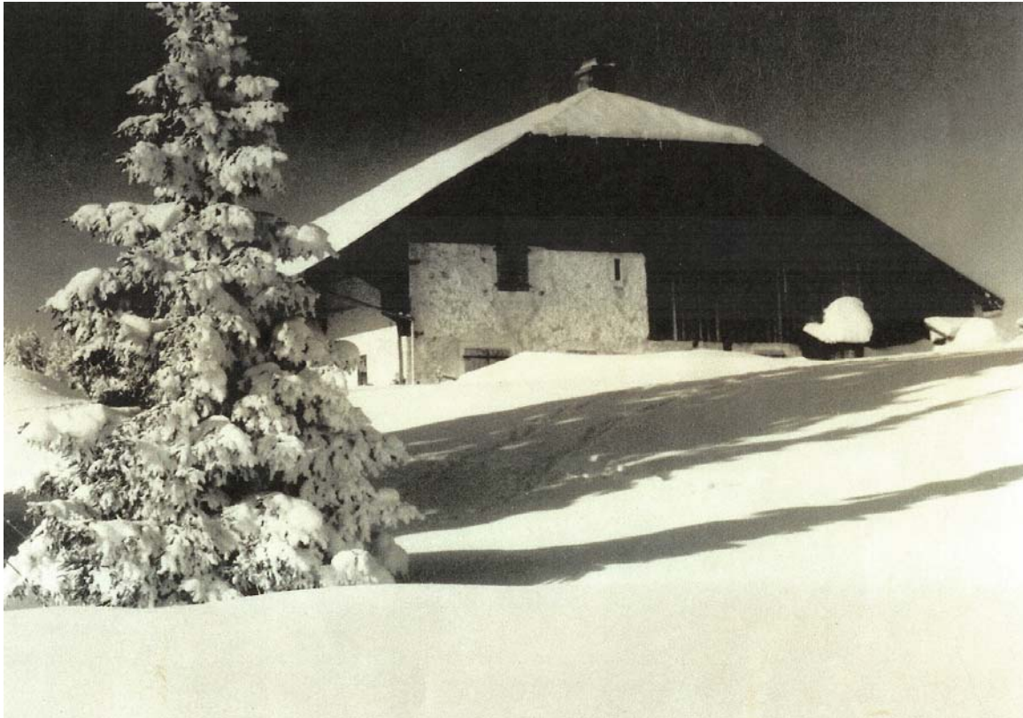
La Landoz Neuve, peu après le Poteau, au bord de la route qui vous conduira bientôt à la Vieille Landoz.

odeurs, saines odeurs, celle du bétail en plus qui te provient même s'il est en pâture à des cents mètres de là. Il poursuit son chemin jusqu'à arriver enfin à la Vieille Landoz qui a plus de charme que la Landoz Neuve trop simple dans ses formes.