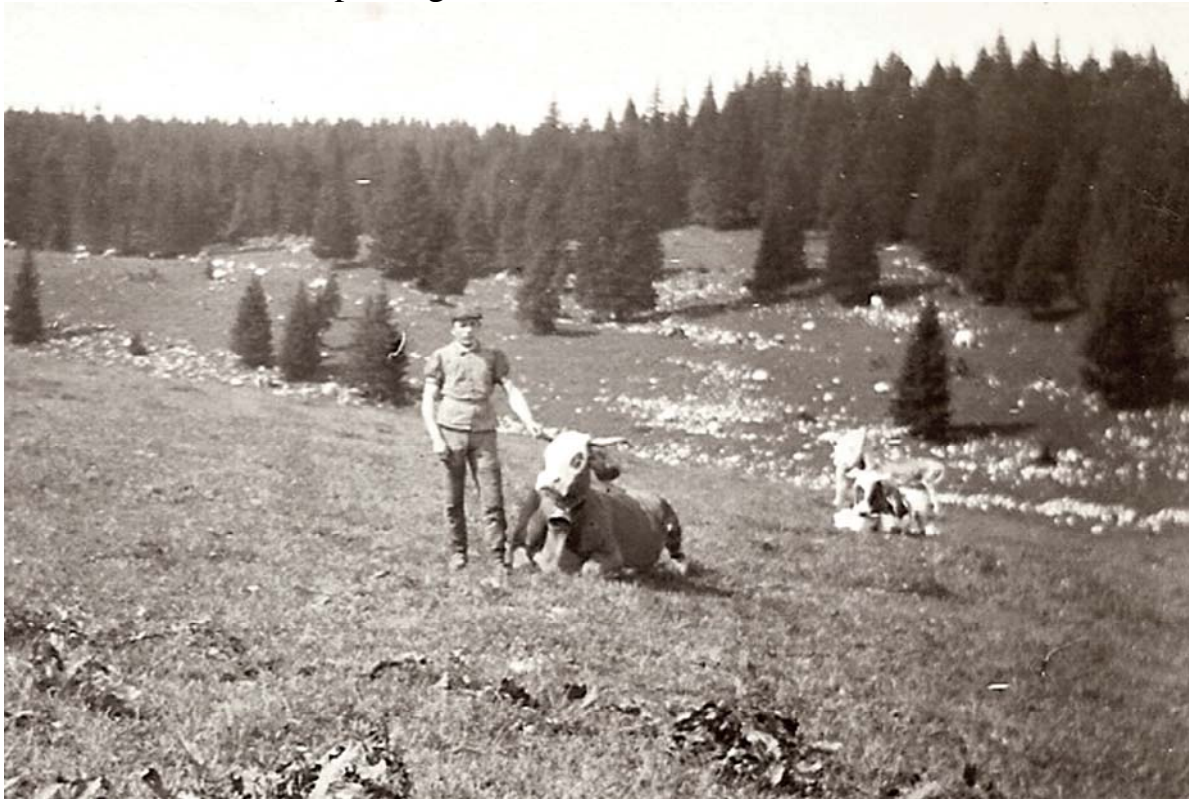
Titi avec la Baronne dans la grande combe que l'on trouve en dessous du chalet.

six ou sept kilomètres pour monter, autant pour redescendre. Et tout ça pour une goutte de lait pourtant si nécessaire à la famille qui est nombreuse. Elle part seule à travers bois et pâturages.