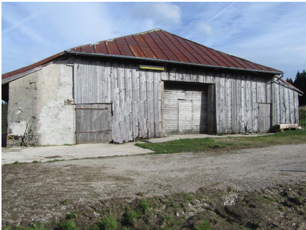
Pignon vent, tel qu'autrefois.